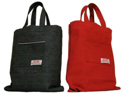
撥水トートバッグ