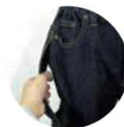
移乗介助しやすい ズボン