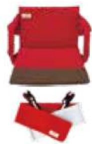
てこの原理を活用して 移動できるクッション