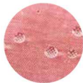
雨も醤油も弾く撥水シャツ