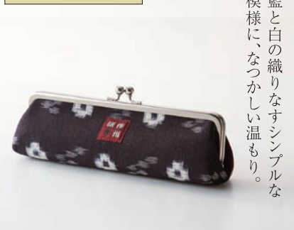
作州紬工房 ひな屋