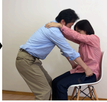
持ち手をつかみます