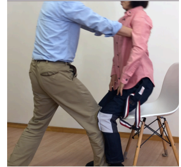
膝を押し当て重心を後ろに引くと相手が上がります