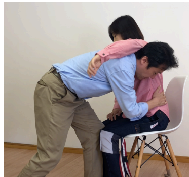
押し当てる足と逆の脇に頭を入れます。相手の背中に腕を回し上体を持ち膝をつきます。