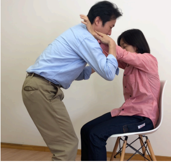
肩に手をかけてもらいます