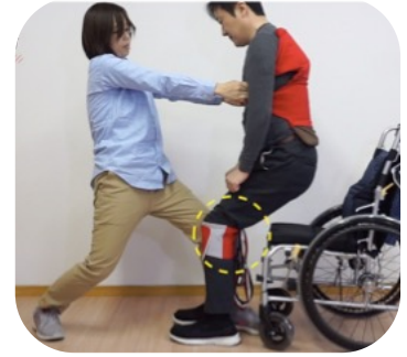
重心を自分の後ろ側の足に移します。自分の体を後ろに引きながら、リフティの持ち手を引っ張ります。