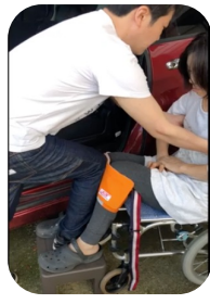
相手の膝にピーヴォを巻く。台の上で自分の片足をピーヴォに押し当てる