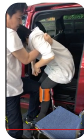
相手の両脇の下に自分の手を入れて後ろに引く。回転して車いすに座る