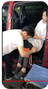
台の上に相手の両足を乗せる