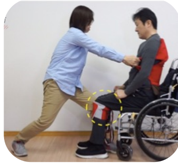
ピーヴォに自分の膝を押し当て脇の下からリフティの持ち手をつかみます