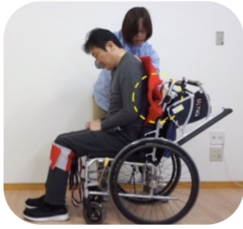
リフティを背中に差し込みます