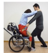
軽い相手は大きく前傾にしないで使える