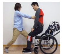
自分と同等の体重なら上げられる トランスファーボードと組み合わせても良い