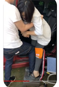
回転して相手のお尻を座席に乗せる