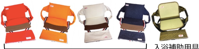
（貸与）特殊寝台付属品 入浴補助用具

介護保険適用（貸与）：リフティピーヴォ 福祉用具貸与 特殊寝台付属品 簡易リフト TAISコード： 01652-000005（デニム生地：インディゴ） 01652-000006（帆布生地：レッド、オレンジ、ホワイト）