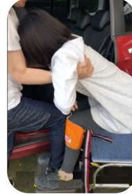
相手の両脇の下に自分の手を入れて後ろに引く