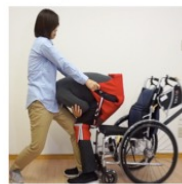
座位を保てない相手は腹部にクッションを挟んでも良い